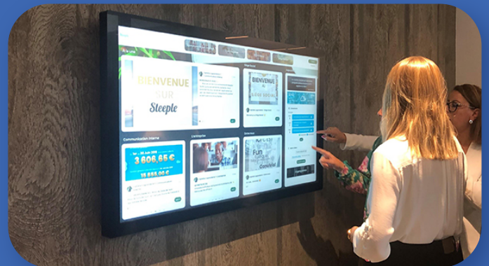
Les collaborateurs de Le Roy Logistique découvrent Steeple