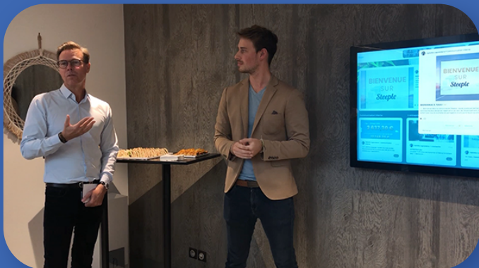
Photo du déjeuner pour le lancement de Steeple

Les responsables d'agences ont ensuite pris la parole, avec une démonstration de l'outil , afin que chaque collaborateur prenne connaissance des fonctionnalités, et de ce que pouvait apporter l'outil dans le cadre de notre communication interne. L'outil a été bien accueilli par l'ensemble de l'entreprise.