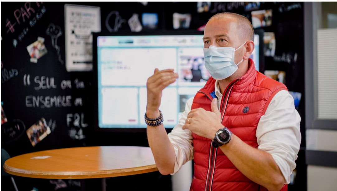
Super U Mordelles

Le secteur de la distribution fait partie de ceux dont le problème de recrutement, l'absentéisme et le turnover constituent un enjeu majeur en 2022. Pour favoriser la cohésion d'équipe, malgré la distanciation, les magasins adoptent des solutions de communication interne, dont Steeple.